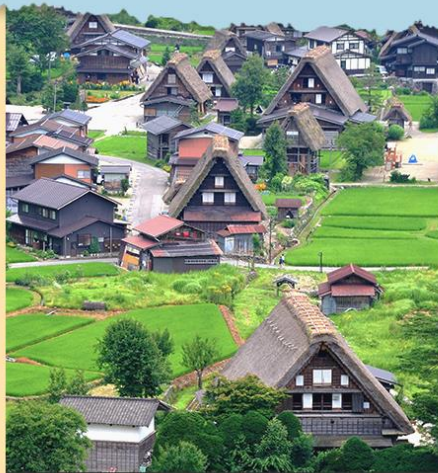
白川合掌村 聯合國登錄為世界遺產之一