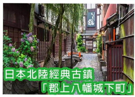
日本北陸經典古鎮 「郡上八幡城下町」