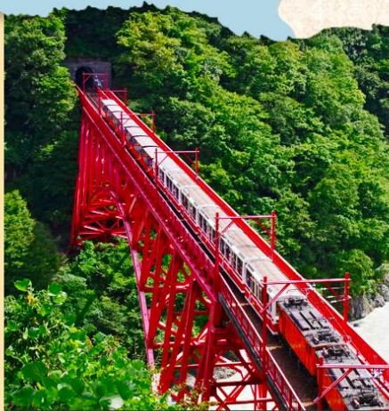
黑部峽谷鐵道 穿過黑部峽谷的極美景致小火車