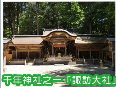
千年神社之一「諏訪大社」