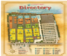
▲購物廣場還貼心提供地圖