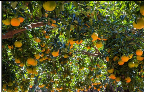
東新觀光果園(或其他果園)